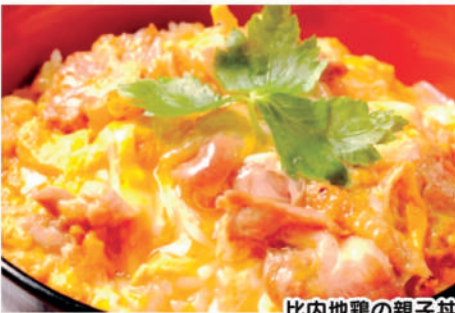
比内地鶏の親子丼