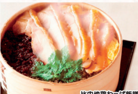
比内地鶏わっぱ飯膳