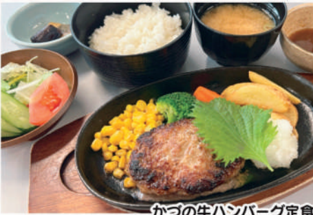
かつの牛ハンバーグ定食