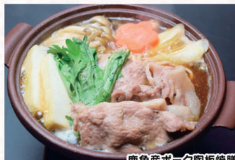
鹿角産ポーク陶板焼