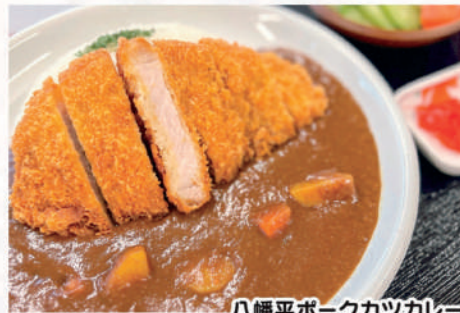
八幡平ポークカツカレー