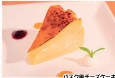
バスク風チーズケーキ