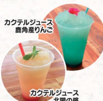
カクテルジュース 北限の桃