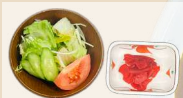
ミニサラダ・福神漬け付