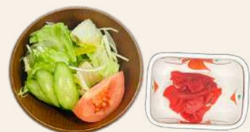
ミニサラダ・福神漬け付